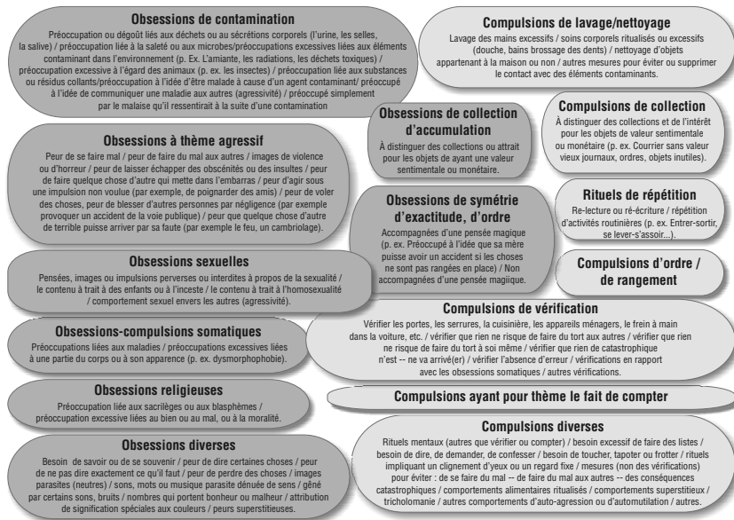
Figure 1.1. Les différents types de symptômes répertoriés dans la check-list de la Y-BOCS (Goodman, 1989)

1989). Cette évaluation semi-structurée comprend une soixantaine de symptômes obsessionnels compulsifs regroupés en huit thématiques d'obsessions et sept de compulsions (cf. annexe). Elle rend compte d'une grande partie des symptômes observés chez ces patients, mais ne permet pas de quantifier l'importance de chaque type de symptômes listés. Des auto-questionnaires comme le Maudsley Obsessionnal Compulsive Inventory (MOCI) (Hodgson, 1977) ou l'inventaire de Padoue (Sanavio, 1988) donnent une appréciation quantitative, mais centrée sur quelques dimensions du TOC seulement.